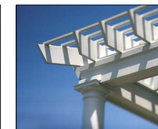
Pergolen / Carports